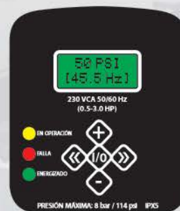
Display del variador