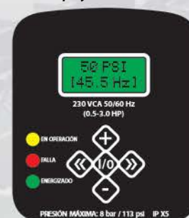
Display del variador